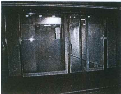
エントランス有り。