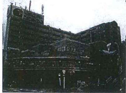
千里丘のランドマーク