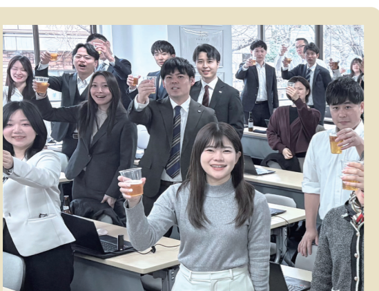
月に一度、社内で食事をしながら(お酒もOK)行なう「飲み会議」。リラックスした雰囲気の中で、グループ内の情報共有や様々なテーマに関するディスカッションを行なっている。役職や入社年次にかかわらず自由闊達な意見・アイデアが出やすく、「全員経営」を実践するための重要な取り組みの一つ。