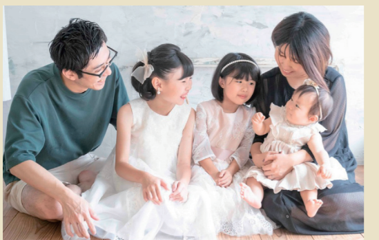
社員が働きやすい環境の整備にも積極的。子どもが生まれた社員には、子ども1人につき月5万円(3人ならば月15万円)の扶養手当を20歳になるまで支給する。産休取得者の復帰率は100%に達し、厚生労働省認定の「子育てサポート企業」の証「くるみんマーク」も取得。