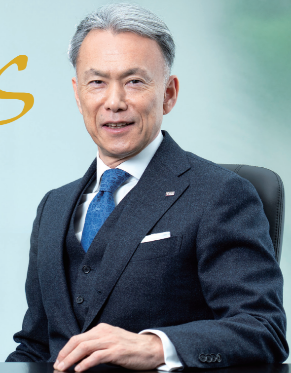
取材・構成：橋口佳紀子