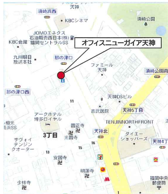
「那の津口交差点」角地