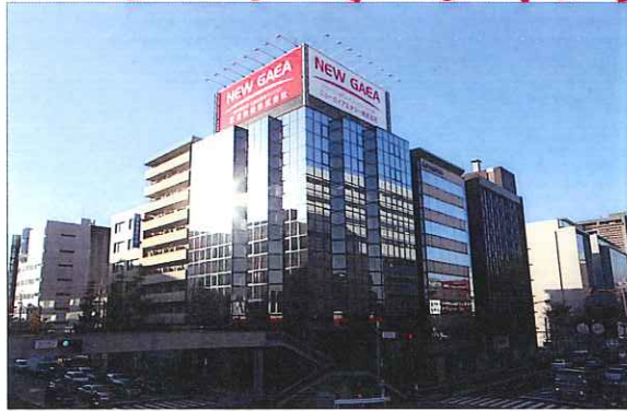
KBC朝の天気予報でもおなじみの建物です