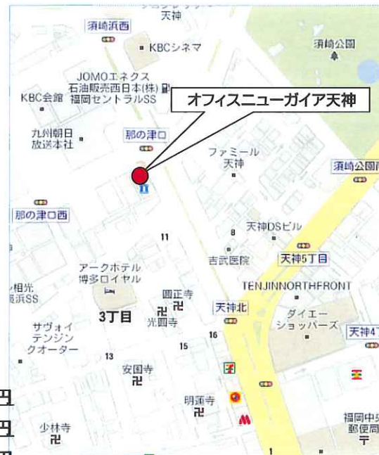
「那の津口交差点」角地