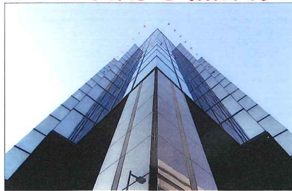
ガラス張りのインテリジェンスな外観