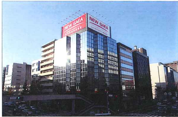
KBC朝の天気予報でおなじみの建物です