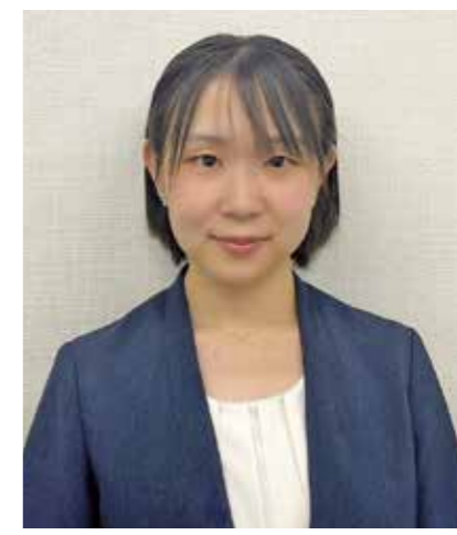
フォーシーズ(東京都港区) 神戸支店マネージャー