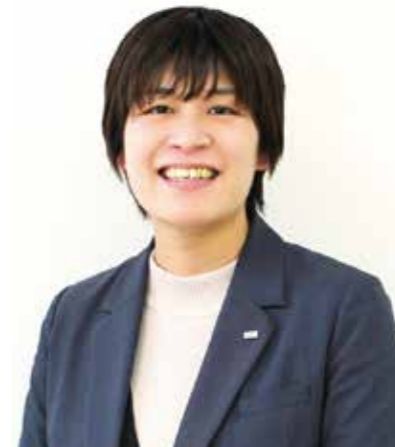
フォーシーズ(東京都港区)